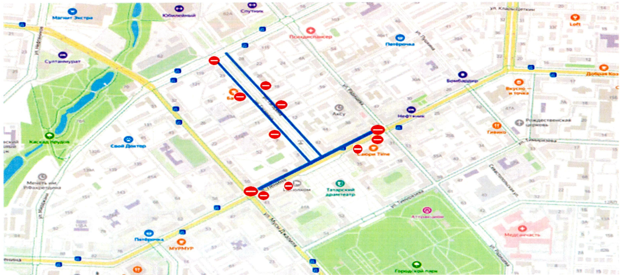
СХЕМА временного ограничения движения транспортных средств в период проведения мероприятий, посвященных Дню работников нефтяной и газовой промышленности в городе Альметьевске с 30 августа по 2 сентября

Приложение № 2 к постановлению исполнительного комитета Альметьевского муниципального района от « 19 » июля 20 24 г. № 2338