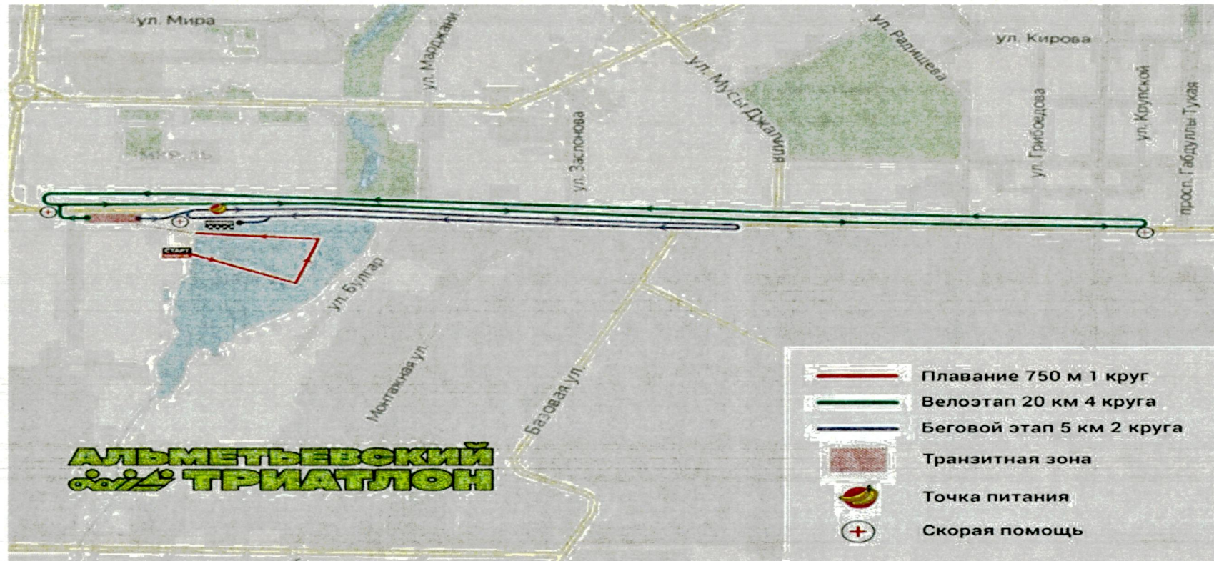
Схема трассы Первенство России по триатлону, Чемпионата России по триатлону спорт слепых и любительских соревнований «Альметьевский триатлон-2024»

Приложение №1 к постановлению исполнительного комитета Альметьевского муниципального района от " 6 " марта 20 24 г. № 1400